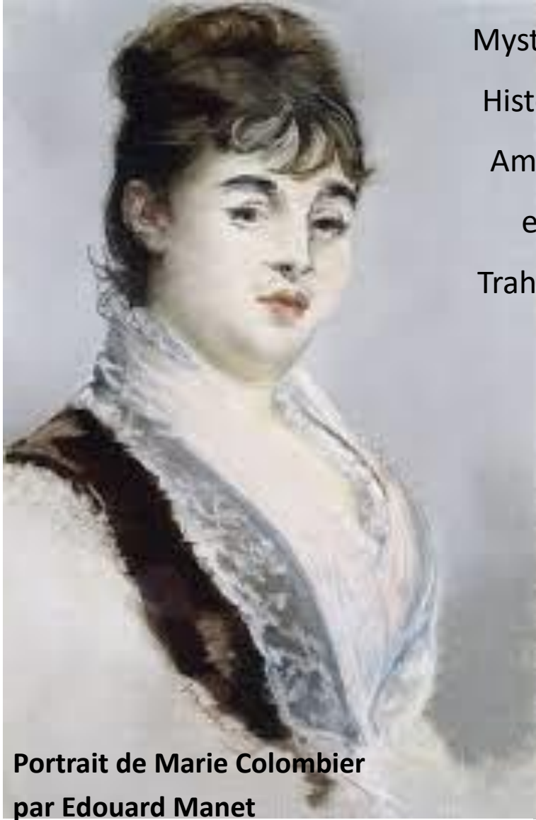
Portrait de Marie Colombier par Edouard Manet