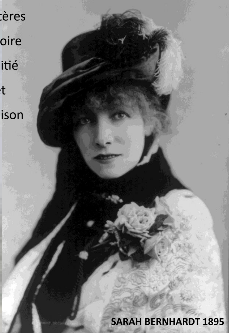
SARAH BERNHARDT 1895